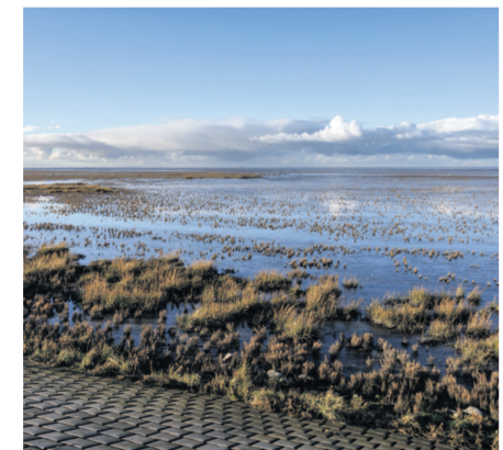
CDA is trots op ons werelderfgoed

Er is extra geld voor groenbeleid, iets waar we ons als CDA altijd hard voor hebben gemaakt. Hoewel er veel aandacht is voor woningbouw, gaat dit ons als CDA nog niet voortvarend genoeg. Ook starters dienen voldoende mogelijkheden te krijgen. Binnen de kleinere kernen liggen wat ons betreft eveneens mogelijkheden. We zijn blij met de nieuwe subsidieregeling Dorpshuizen, hoewel er naar ons idee nog de nodige finetuning moet plaatsvinden. Over het onderwijshuisvestingsplan zijn we als CDA erg tevreden. De plannen die