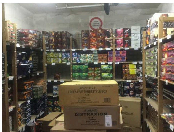
Vuurwerkcontrole Vierhuizen, bufferbewaarplaats