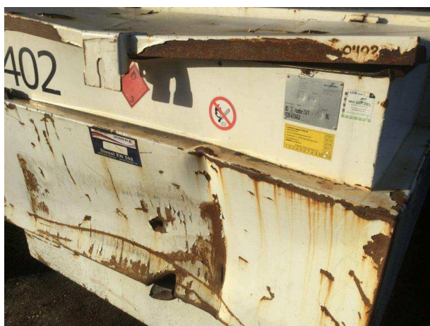
Milieucontrole inrichting in Pieterburen, mobiele dieseltank

Zijn bodembeschermende voorzieningen bestand tegen de inwerking van de 2 opgeslagen vloeibare bodembedreigende stoffen en de condities waaronder deze stoffen worden gebruikt of opgeslagen?