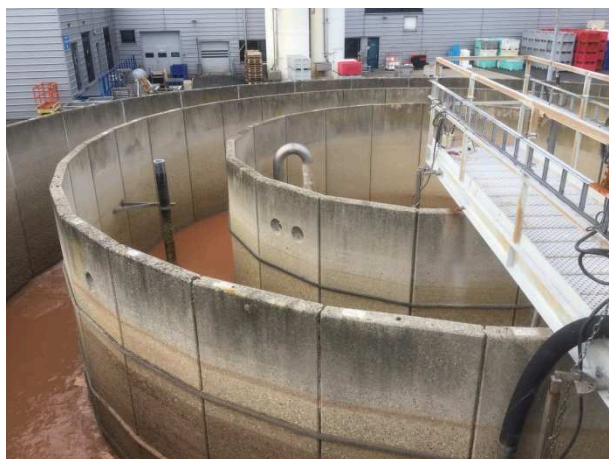
Piket klacht bij een productiebedrijf, vooropslag AWZI