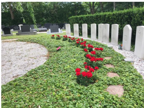
Oorlogsgraven begraafplaats Ulrum