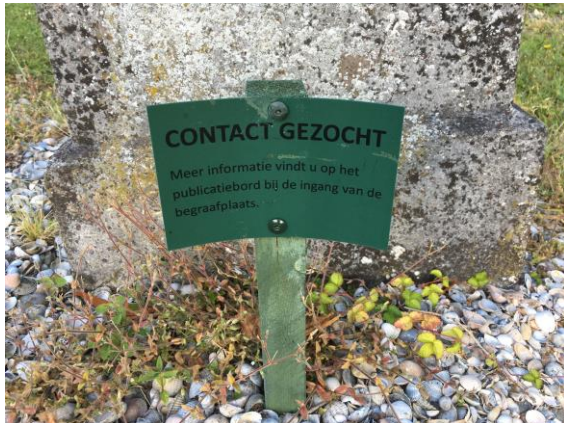
Oproep rechthebbenden begraafplaats Winsum

het betreffende graf om contact op te nemen. De wet beschrijft voor enkele specifieke situaties wanneer en gedurende welke tijd dat moet.