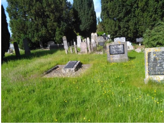
Extensief beheer begraafplaats Baflo

De begraafplaatsen van Maarhuizen, Ranum, Bellingeweer, Onderwierum en Klein Maarslag worden extensiever beheerd. In de praktijk betekent dit dat de inrichting zeer sober is en het maaibeheer extensiever. Op kleine schaal is dit ook op een enkele andere begraafplaats toegepast. Het betreft bijvoorbeeld een ouder deel van de begraafplaats van Baflo waar nog maar heel zelden wordt begraven. Ook de ruimte voor toekomstige uitbreiding wordt vooralsnog extensief beheerd.