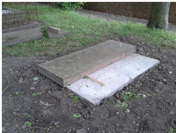
restauratie graven Bellingeweer

Er zijn enkele begraafplaatsen die de status van rijksmonument hebben. Met behulp van subsidies zijn daar graven hersteld.