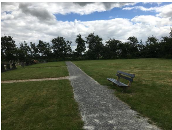
Mogelijke ruimte voor uitbreiding begraafplaats Eppenhuizen

In een enkele situatie is het door een beperkte herinrichting mogelijk extra reguliere graven te realiseren. Aandachtspunt hierbij is dat dit afbreuk kan doen aan het ontwerp.