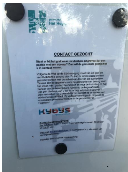
Oproep op publicatiebord

Digitale kanalen zijn wel beschikbaar maar kunnen voor dit doel beter benut worden. Op de begraafplaatsen zelf zijn niet overal mogelijkheden aanwezig om informatie te geven.