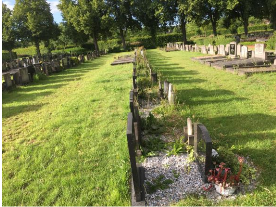
vergroenen paden begraafplaats Bedum