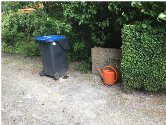
Voorzieningen begraafplaats Kantens

Op enkele begraafplaatsen is een aula, deze zijn geen eigendom van de gemeente maar meestal van een begrafenisvereniging. Een uitzondering is de aula bij de begraafplaats in Warffum, deze is particulier bezit.