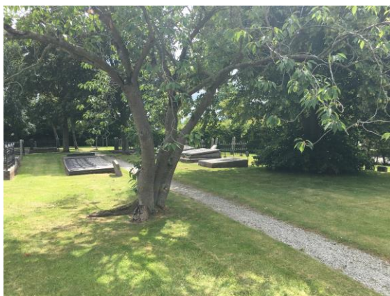
onderhoud door vrijwilligers, Snakkeburen Ulrum

Op meerdere begraafplaatsen zijn voorbeelden te vinden hoe vrijwilligers een bijdrage leveren aan het onderhouden van een begraafplaats. Dat kan gaan om zowel groenonderhoud als het opknappen van grafmonumenten en heeft bijna altijd een positieve invloed op de kwaliteit.