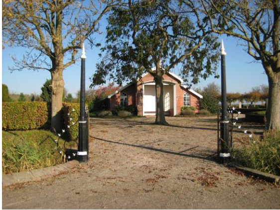
Baarhuisje begraafplaats Baflo