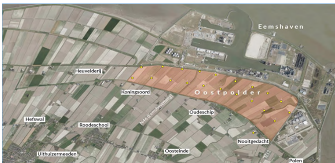
Figuur 1: Locatie van de Oostpolder ten zuiden van de Eemshaven.

De Commissie adviseert deze informatie in een aanvulling op het MER op te nemen, en dan pas een besluit te nemen over de Structuurvisie Oostpolder. In hoofdstuk 2 licht de Commissie haar oordeel toe en geeft ze aandachtspunten voor het vervolgtraject.