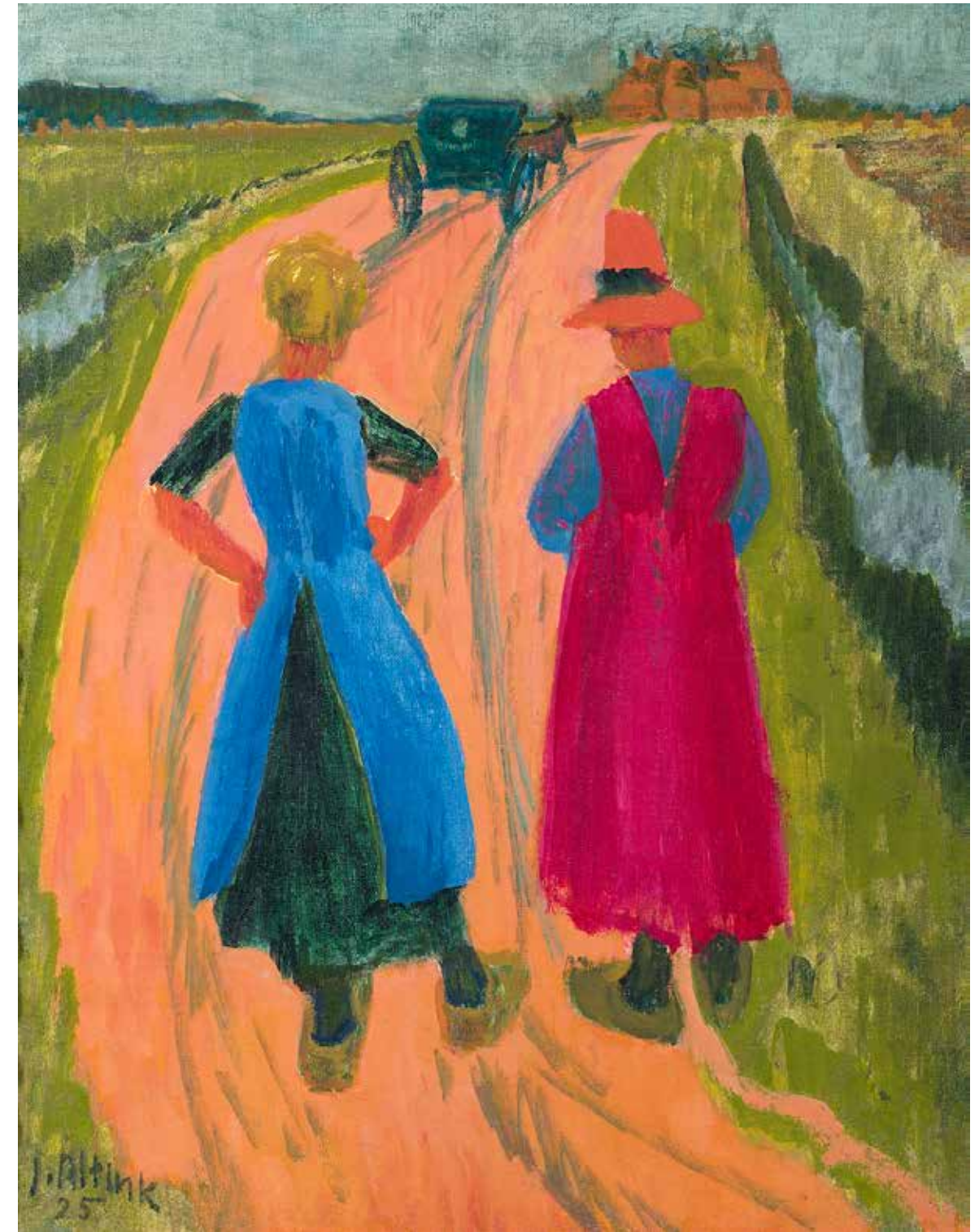
Na het bezoek