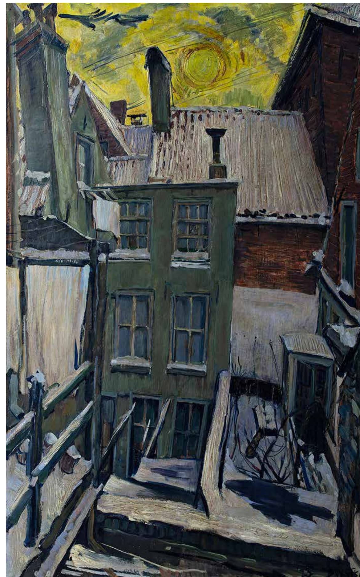
Binnenplaats in de winter – Johan Dijkstra