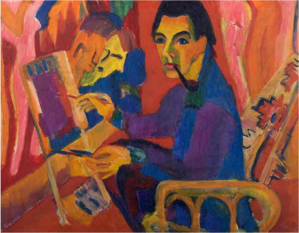
Kirchner in atelier