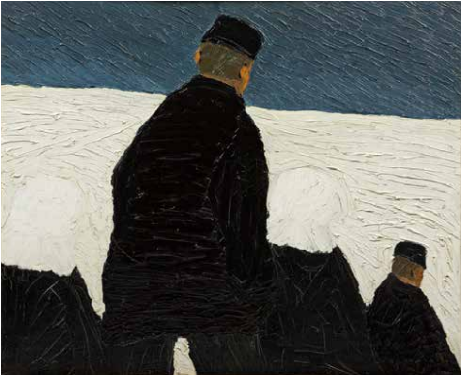
Kerkgang in de sneeuw – H.N. Werkman

In de prognose is bij de start van de openstelling uitgegaan van een minimaal liquiditeitssaldo van € 100.000. Om eventuele onvoorzien uitgaven op te vangen, wordt geadviseerd om te starten met een liquiditeitssaldo van € 150.000.