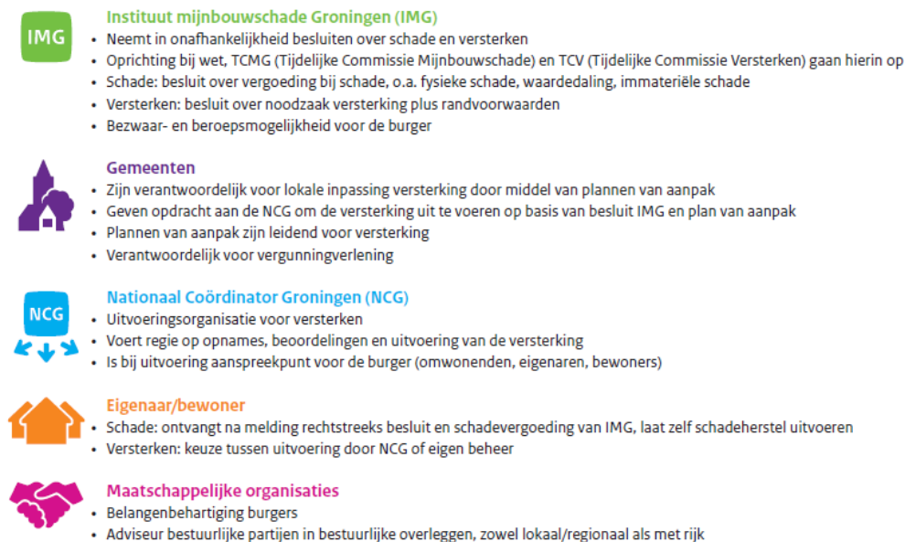
Figuur 2 – Het eindbeeld schade en versterken dat ontstaat na o.a. de wettelijke verankeringen van de nu per besluit vastgestelde werkwijze.