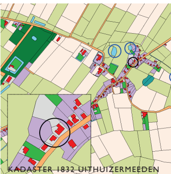
KADASTER 1832 UITHUIZERMEEDEN