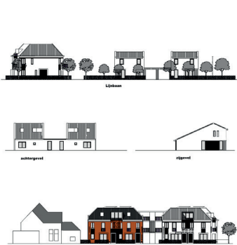
HUBO LOCATIE HOOFDSTRAAT UITHUIZERMEEDEN