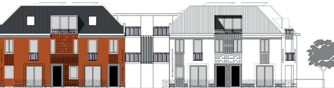
HUBO LOCATIE HOOFDSTRAAT UITHUIZERMEEDEN