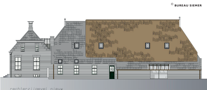
RESTAURATIE BOERDERIJ MAARWEG UITHUIZEN