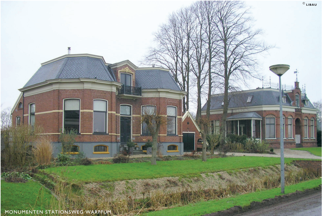
MONUMENTEN STATIONSWEG WARFFUM