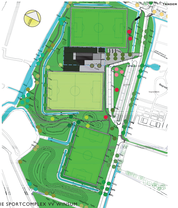
SITUATIE SPORTCOMPLEX VV WINSUM