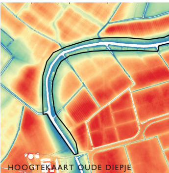
HOOGTEKAART OUDE DIEPJE