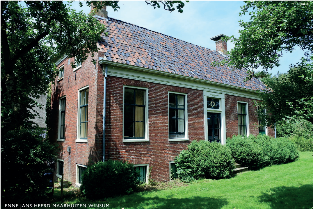
ENNE JANS HEERD MAARHUIZEN WINSUM