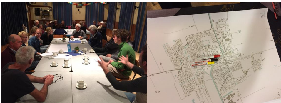
Figuur 1 De dorpsronde: inwoners van de gemeente Bedum delen hun kijk op het wonen