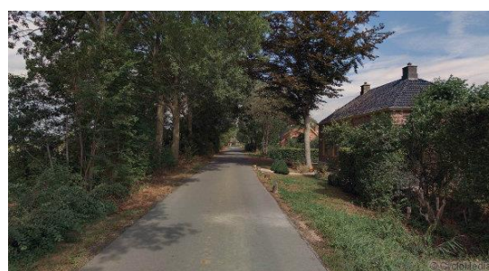
Sfeerbeelden van diverse plekken van Westerdijkshorn