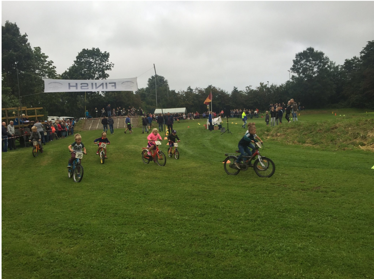
Fietscross in Eenrum