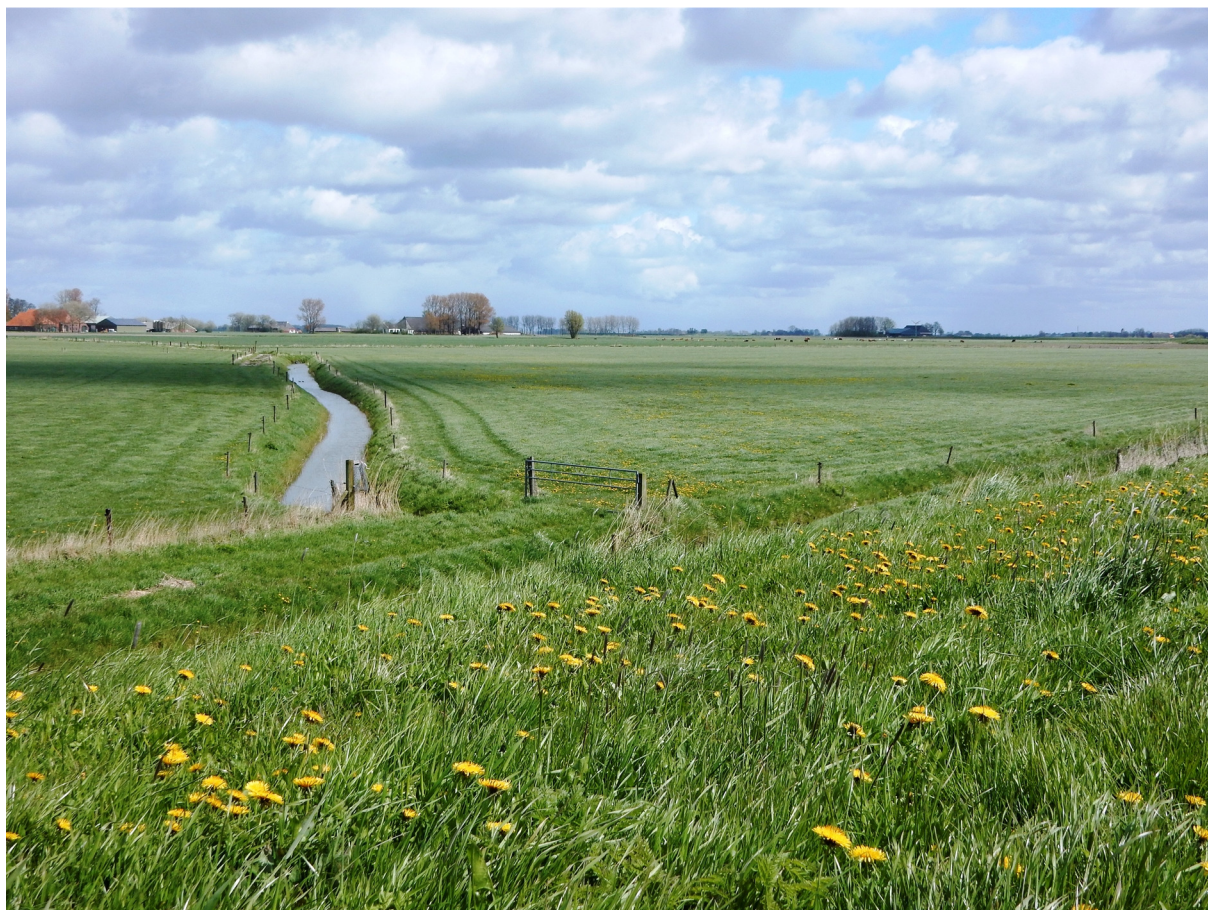
Dijk bij het Reitdiep richting Houwerzijl