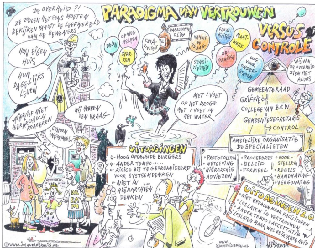
Illustratie door: Kees Willemen

Daarnaast zijn, zoals wij het zien, 'tussenpersonen' nodig die kunnen schakelen tussen de wereld van de inwoner en die van de gemeente. Zij bewegen zich op het kruispunt van de gemeentelijke organisatie en de samenleving. Daardoor zijn ze vrij om, zonder de beperking van een strak omlind kader, te kijken in hoeverre hetgeen de samenleving vraagt, binnen onze eigen organisatie mogelijk is. Deze functie wordt nu vervuld door dorpencoördinatoren.