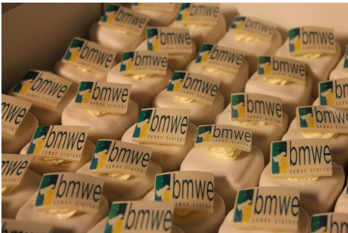
Op weg naar de herindeling BMW