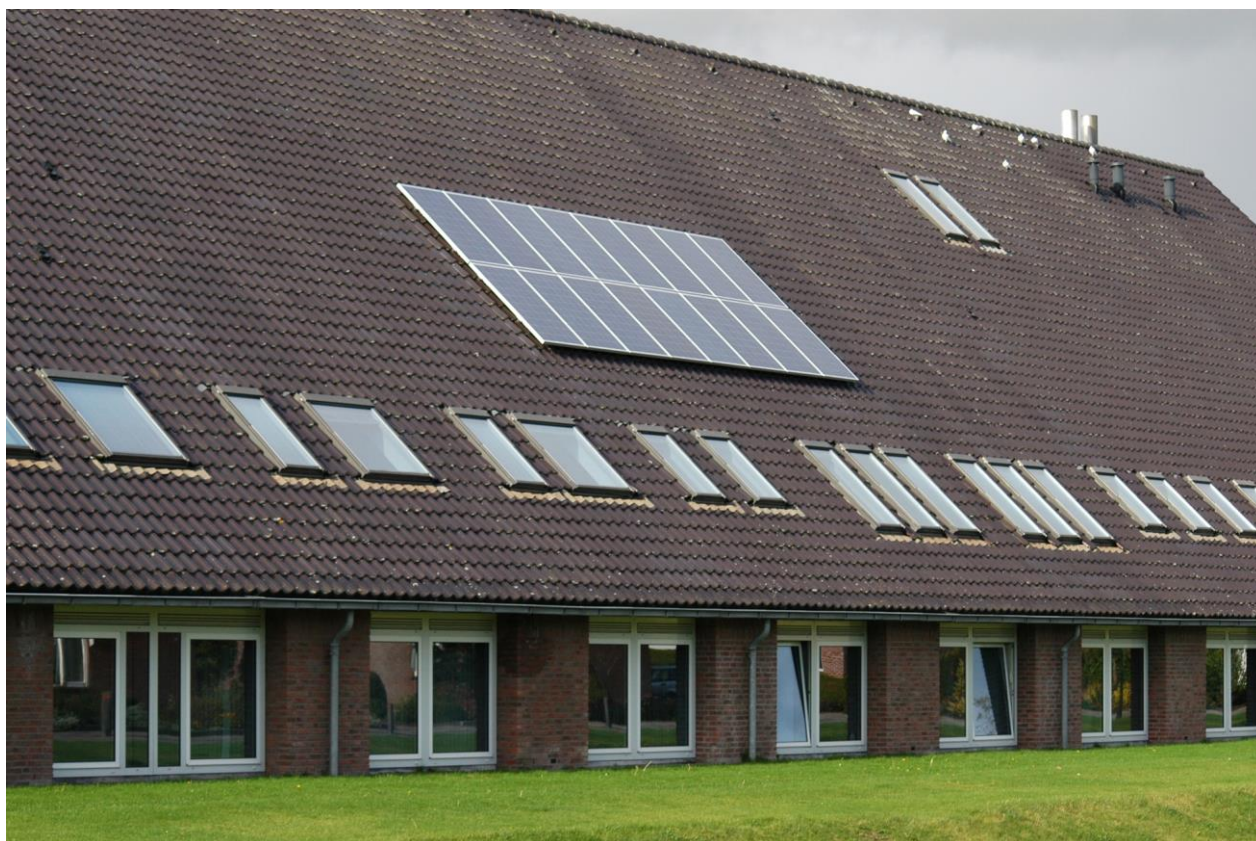
Duurzame energie: zonnepanelen op het gemeentehuis