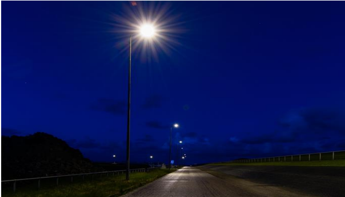
Verlichting: vervanging oude verlichting door LED verlichting Lauwersoog