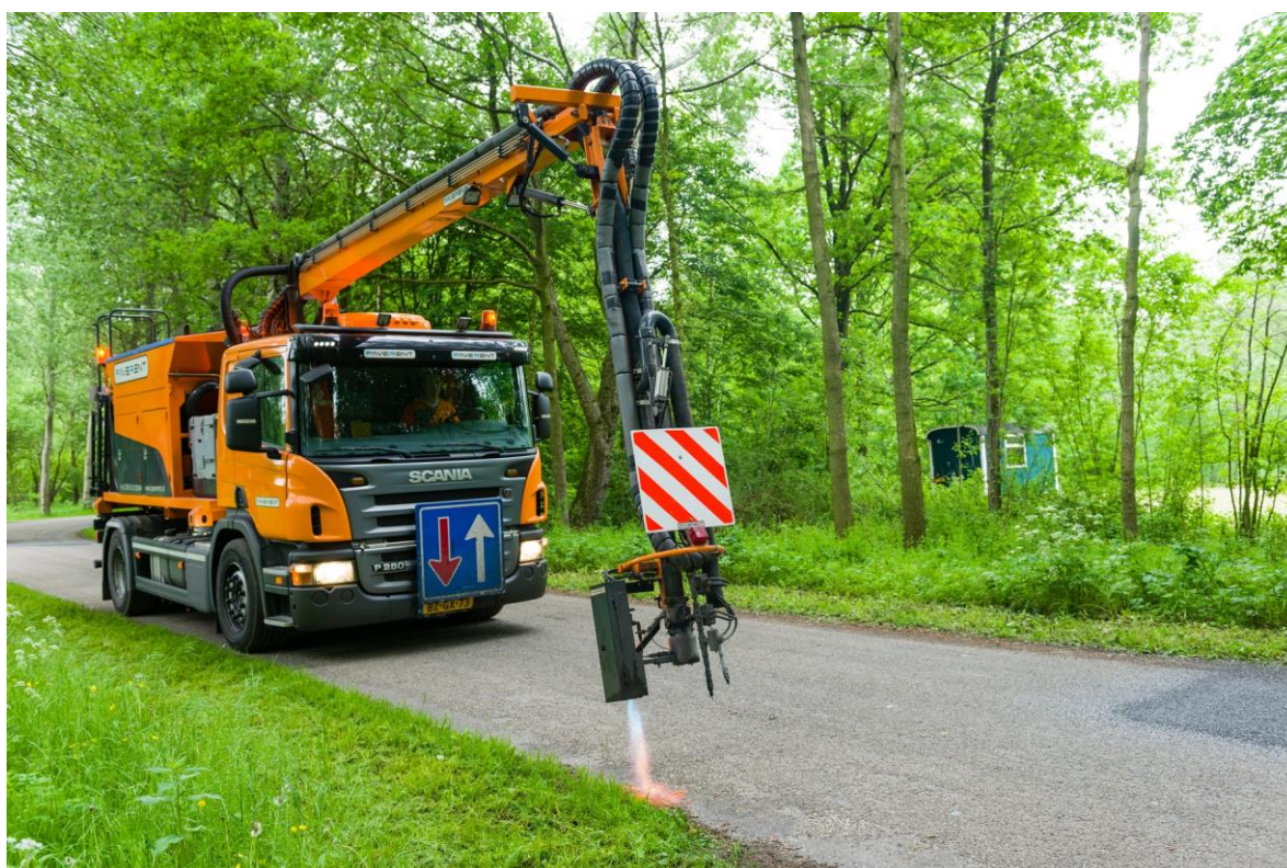
Wegenonderhoud 2016: reparatie met de 'blowpatcher'.