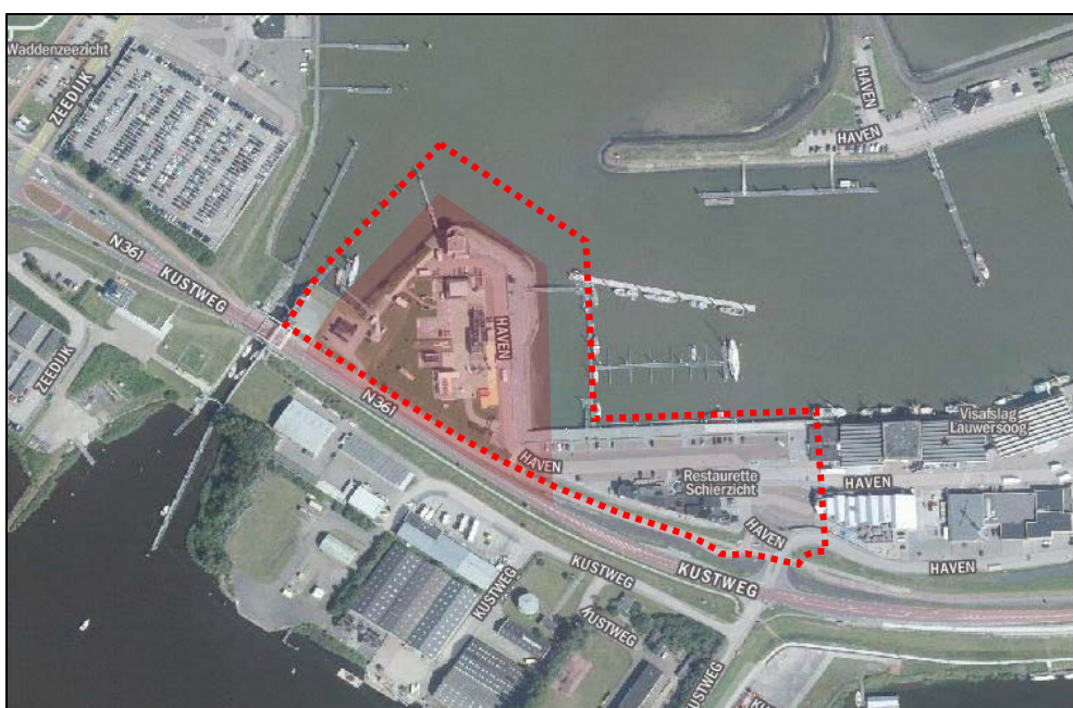
Figuur 2.1 Ligging projectlocatie

De ligging van de projectlocatie is op een luchtfoto weergegeven in figuur 2.1. Het plandeel waarin het zwaartepunt van de ontwikkeling ligt, de voormalige Nordshrimplocatie, is hierin rood gemarkeerd.