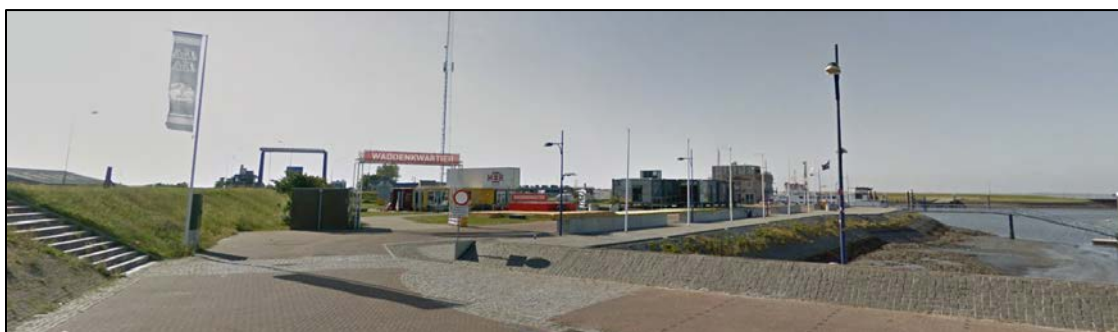
Figuur 2.1 Aanzicht op de voormalige Nordshrimp-locatie