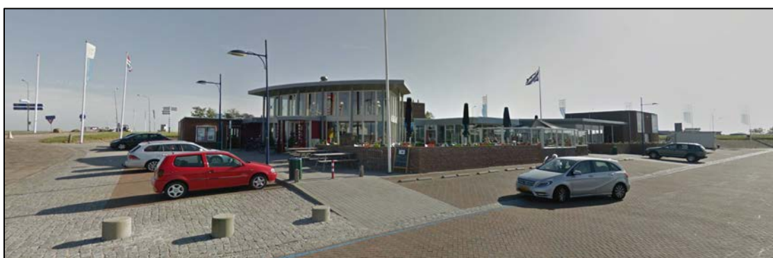
Figuur 2.1 Aanzicht op restaurant Schierzicht

Het restaurant ligt direct ten oosten van de Nordshrimp-locatie. Het betreft een relatief grootschalige accommodatie (circa 1.500 m 2 , inclusief terrassen), die aansluitend aan een parkeerterrein en toegangsweg naar de hiervoor genoemde locatie ligt. Een aanzicht is weergegeven in figuur 2.2.