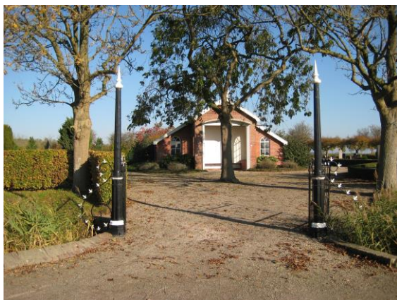
Baarhuisje begraafplaats Baflo