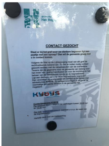
Oproep op publicatiebord

Digitale kanalen zijn wel beschikbaar maar kunnen voor dit doel beter benut worden. Op de begraafplaatsen zelf zijn niet overal mogelijkheden aanwezig om informatie te geven.