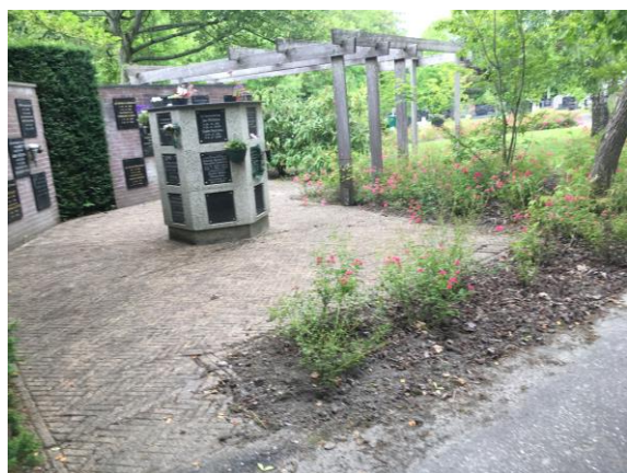
Urnnissen begraafplaats Utrum

Er worden in Het Hogeland momenteel zeer incidenteel algemene graven uitgegeven. Waar gesproken is over graven, betreft het met name particuliere graven, urngraven en urnnissen.