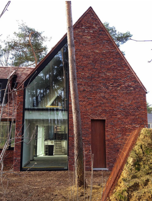
Detaillering ondersteunend aan het hoofdvolume.