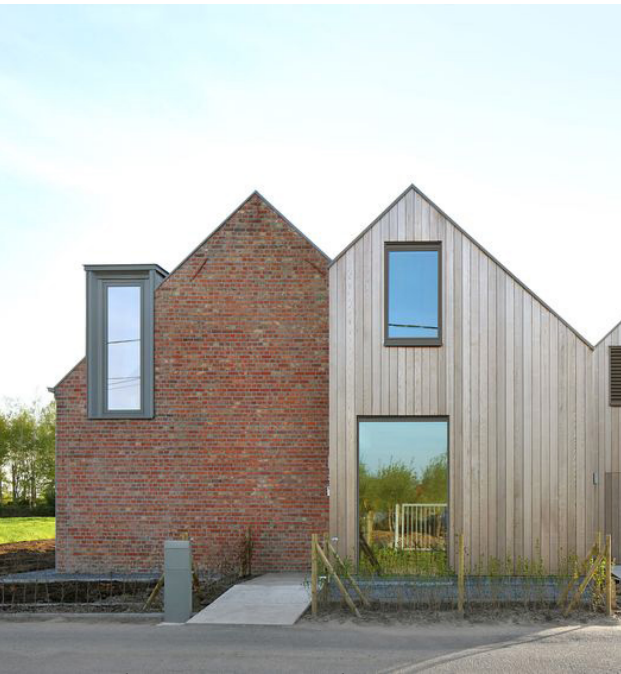
Dorpse uitstraling in vorm en materiaal