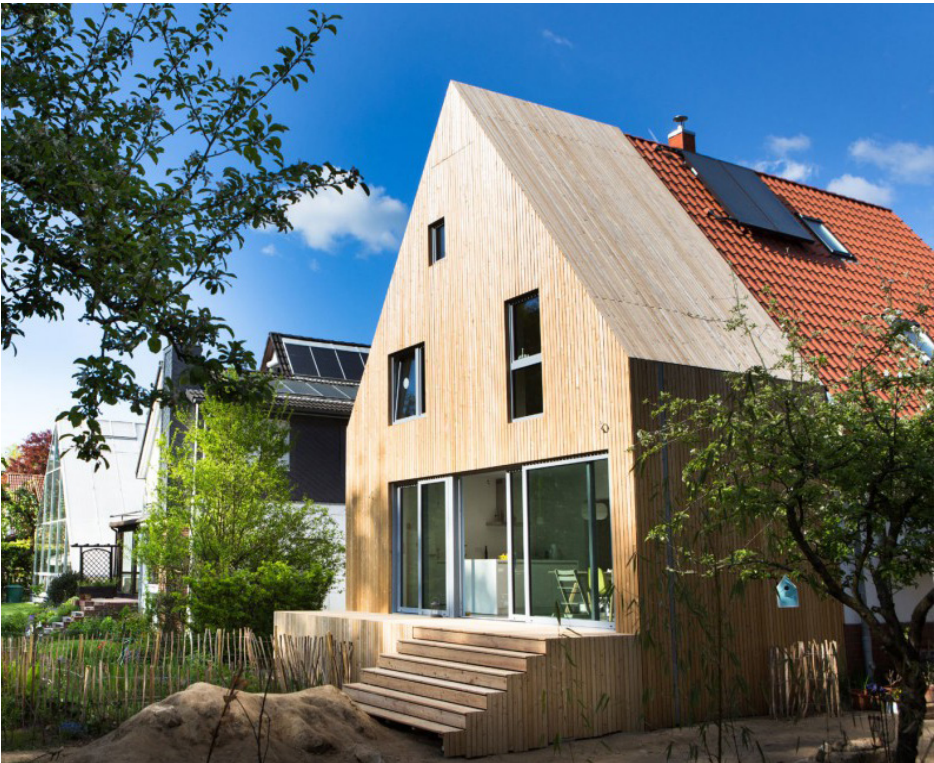
Uitbreidingen passend in het geheel van de hoofdvolume.