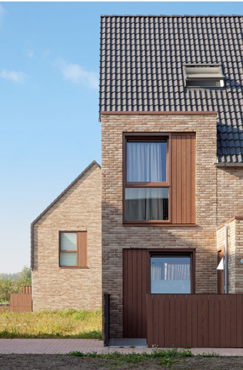
Dorpse uitstraling in vorm en materiaal