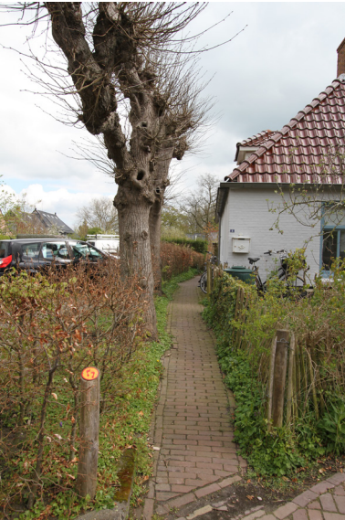
Groene erfafscheiding in Adorp