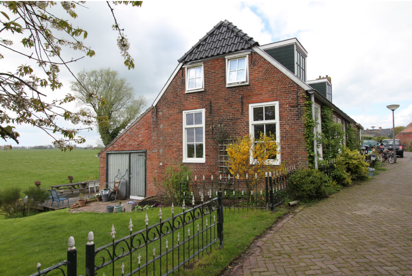
Woningen in Adorp met een versleepte kap