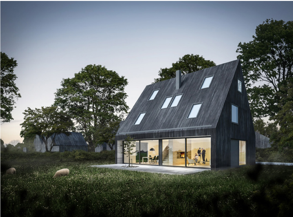
Erfafscheiding d.m.v. groenstructuur en detaillering van goot en HWA ondersteund aan hoofdvolume.