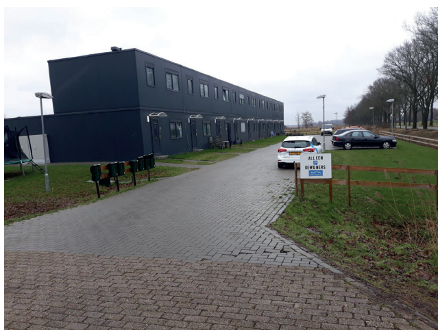
Sfeerimpressie tijdelijke woningen