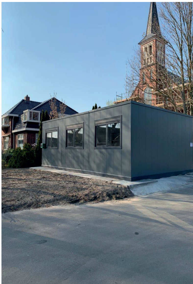
Sfeerimpressie tijdelijk dorpshuis