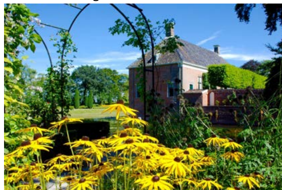
Borg Verhildersum – Foto: Gerrit Alssema

Toerisme draagt in grote mate bij aan de leefbaarheid in onze regio. Het zorgt voor werkgelegenheid en investeringen in de regio. Ons doel is om meer toeristen naar gemeente Het Hogeland te trekken die langer blijven en die dus meer besteden. Deze bestedingen zorgen er weer voor dat voorzieningen op peil blijven, de kwaliteit ervan omhoog gaat en nieuwe ontwikkelingen ruimte krijgen. Ook draagt het toerisme bij aan verbetering van het vestigingsklimaat van de gemeente Het Hogeland voor nieuwe bewoners en bedrijven. Bezoekers keren met een goed gevoel huiswaarts of zijn zelfs dusdanig enthousiast geworden dat ze zich uiteindelijk zelfs gaan vestigen in de regio. Toerisme draagt in die zin sterk bij aan het imago van Het Hogeland als woon-en-werkgebied.