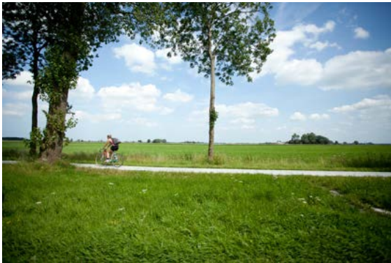
Fietsen door Waddenland

Ten aanzien van het nieuwe Waddenzee Werelderfgoed Centrum (WEC) zien we onszelf als volwaardige partner en zien daarmee een belangrijke taak voor ons weggelegd in het informeren van bezoekers naar Het Hogeland als aangrenzend Waddenkustgebied.