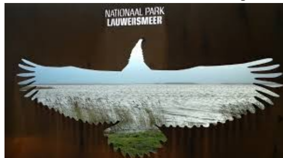
Nationaal Park Lauwersmeer

De kracht van de nieuwe toeristische promotie organisatie zien wij vooral in de korte lijnen naar ondernemers en organisaties. Dit maakt het eenvoudig om behoeften en wensen te inventariseren en ideeën op te halen om deze te vertalen naar concrete producten. De nieuwe toeristische promotie organisatie is een ondernemende organisatie. Wij brengen toeristische ondernemers samen. Op deze wijze wordt de regio van onderop op de kaart gezet. Het aanwezige toeristische aanbod en de behoeften van deze ondernemers om hun bedrijfsvoering nog beter uit te kunnen oefenen zijn dé sleutel tot het toeristisch vermarkten van het gebied.