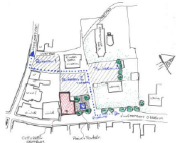
BRAINSTORM SCHETS CENTRUMPLAN WINSUM DD. 25-01-2010 SCHAL: 1:1.500 GET: HK.