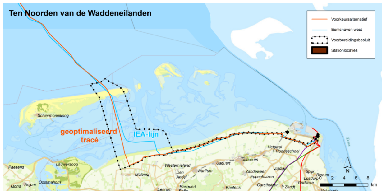
Overzicht voorkeursalternatief Eemshaven west met zoekstrook en inclusief de twee opties voor een transformatorstation

Ten aanzien van het transformatorstation zijn voor de route Eemshaven west twee opties mogelijk in het Eemshavengebied: de locatie Waddenweg en de locatie Middenweg. De twee opties lijken nu erg gelijkwaardig, met ieder voor- en nadelen. Beide locaties worden komende maanden verder uitgewerkt, waardoor de geschiktheid beter ingeschat kan worden en het ministerie van EZK een keuze kan maken voor het beste alternatief.