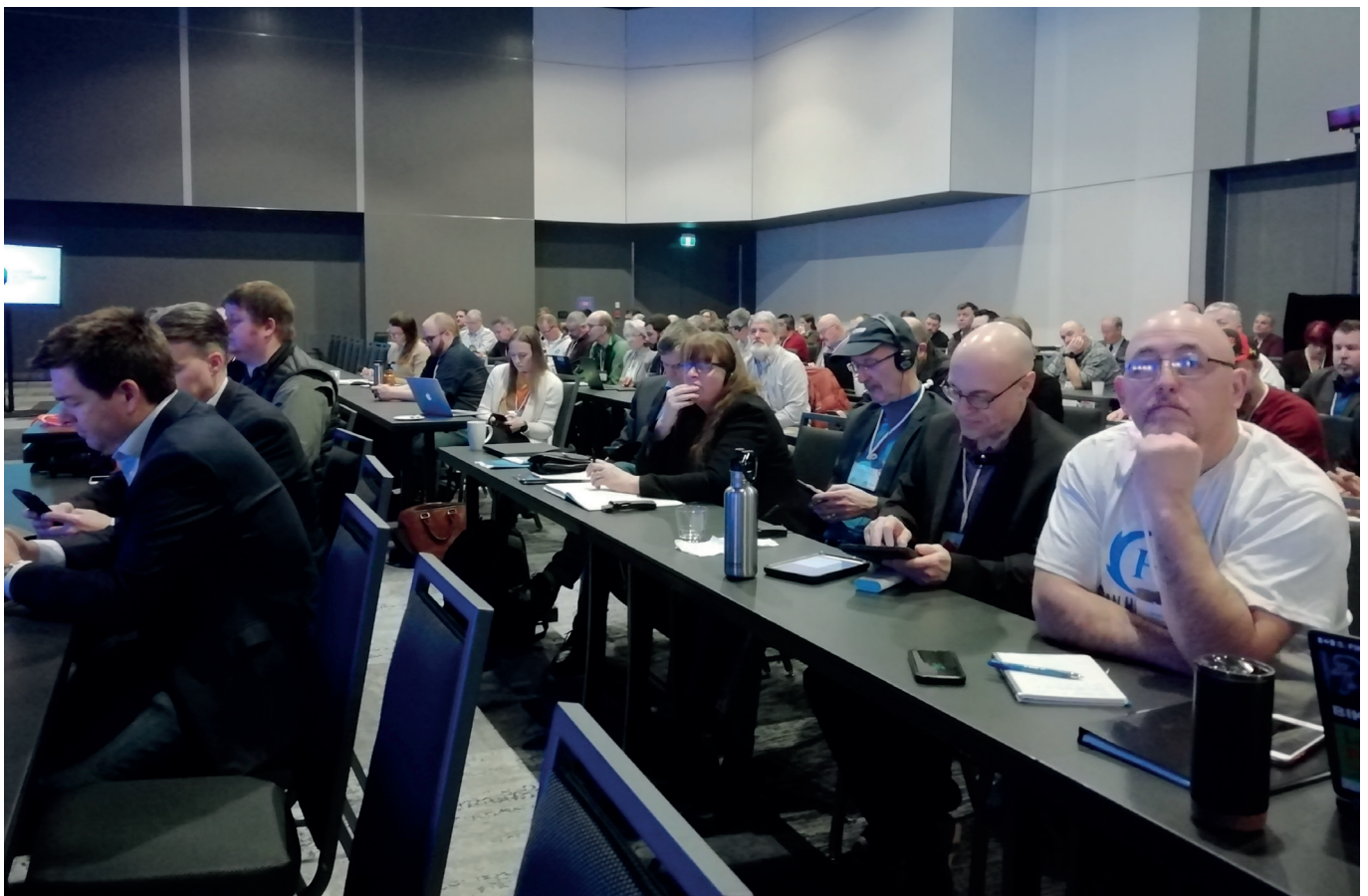
Foto: Deelnemers aan een publieksbijeenkomst over zeebeleid