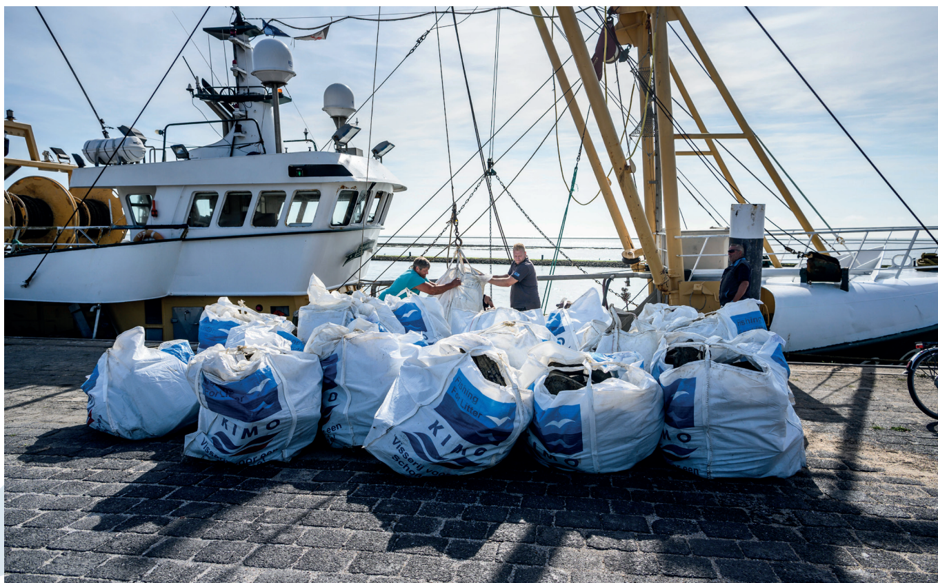
Foto: Afval van het containerschip de MSC Zoë op de kade van de vissershaven van Lauwersoog