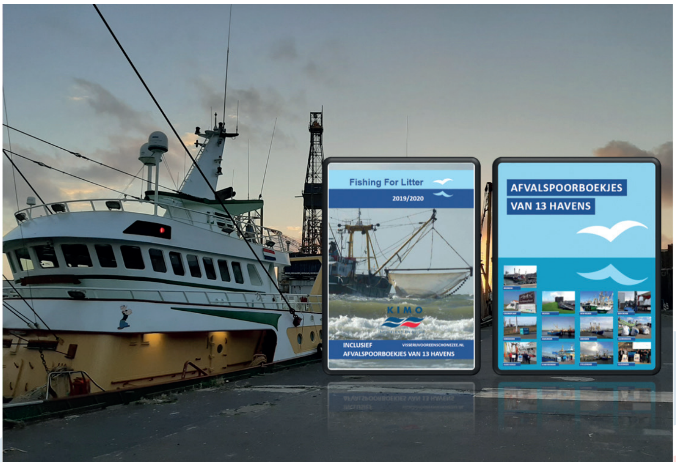
Foto: Jaarverslag Fishing for Litter en afvalspoorboekjes voor 13 Nederlandse havens

tuinbouw. Ook kunnen ze worden gebruikt door startup 'Dunia Design' om circulaire meubels te maken. Op deze manier is de gehele circulaire keten dicht bij elkaar te vinden, wat resulteert in vermindering van CO2 uitstoot én kosten op het gebied van transport en wat duurzaam hergebruik van visnetten waarborgt.