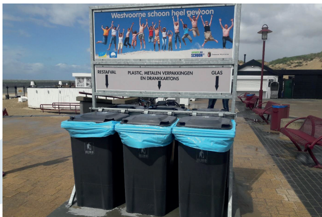
Foto: een afvaleiland op een strand van Westvoorne

De Green Deal Schone Stranden is op 20 november 2014 door 35 partners ondertekend en daarna gestaag gegroeid. Binnen het kennisnetwerk en stimuleringsplatform zetten overheid, gemeenten, paviljoenhouders, belangenorganisaties, bedrijven en energieke vrijwilligers zich gezamenlijk in tot het behalen van de volgende doelstellingen: structureel schonere stranden, goede samenwerking en afstemming tussen partijen en gedragsverandering van strandbezoekers. De Green Deal is sinds 2014 door maar liefst 44 partijen, waarvan 22 kustgemeenten ondertekend. In 2021 moet het kennisnetwerk op zichzelf kunnen staan, gedragen door alle partners.