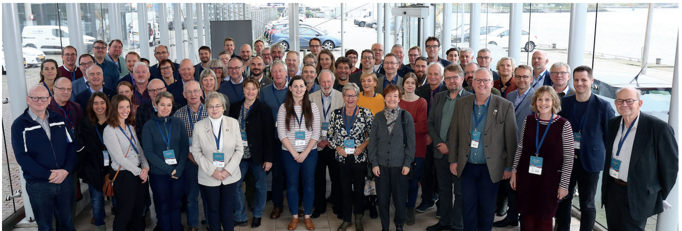
De KIMO-leden en personeel tijdens de laatste fysieke internationale ledenvergadering (AGM), in Velsen in 2019