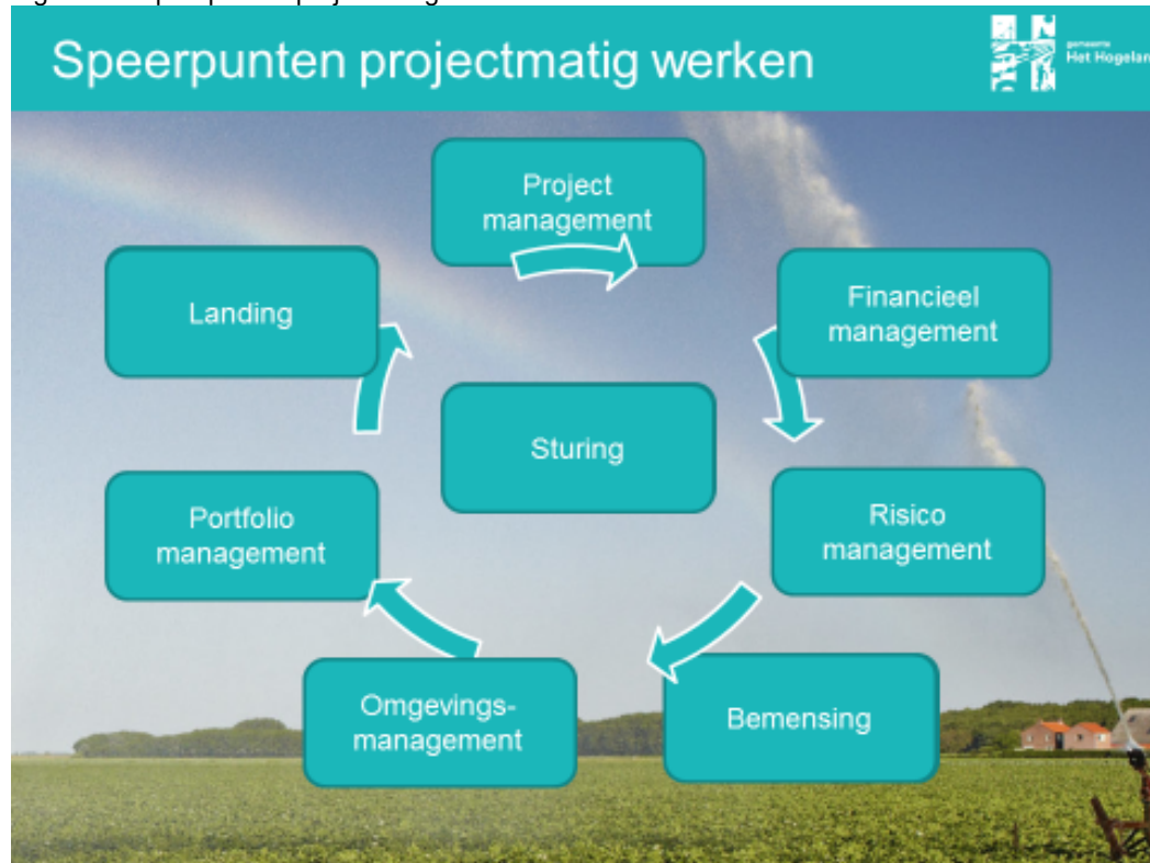
Figuur 2.1 Speerpunten projectmatig werken

De speerpunten vormen gezamenlijk de sturing die we wensen en nodig achten voor het goed grip houden op de (grote) projecten. Per speerpunt volgt een korte toelichting: