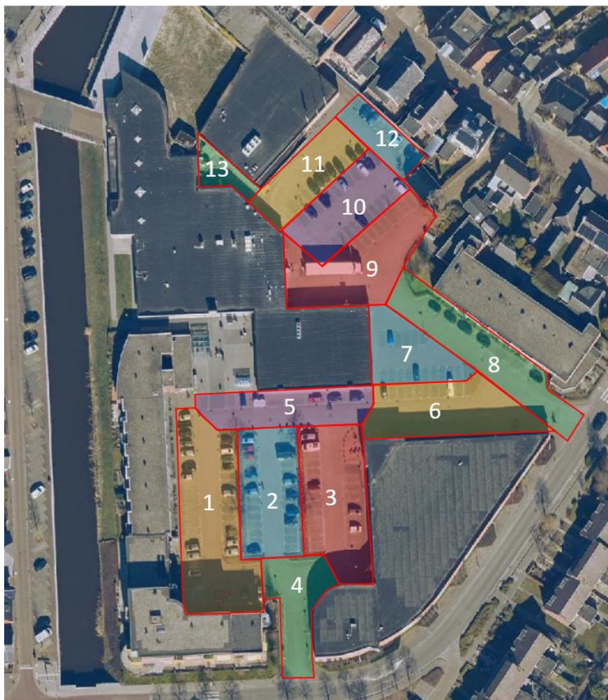
Figuur 3.1 Studiegebied met sectie indeling parkeer