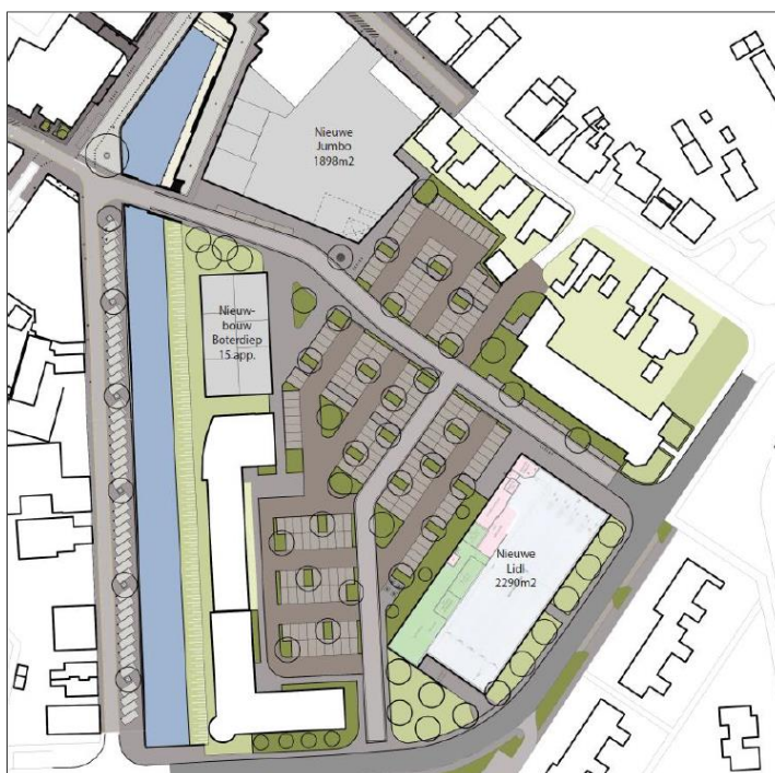
Figuur 1.1 Plankaart Molenerf Uithuizen

Hiervoor zijn een invalshoek vanuit de theorie (hoofdstuk 2) en vanuit de praktijk (hoofdstuk 3) gecombineerd, wat resulteert in een advies over de benodigde parkeercapaciteit (hoofdstuk 4).