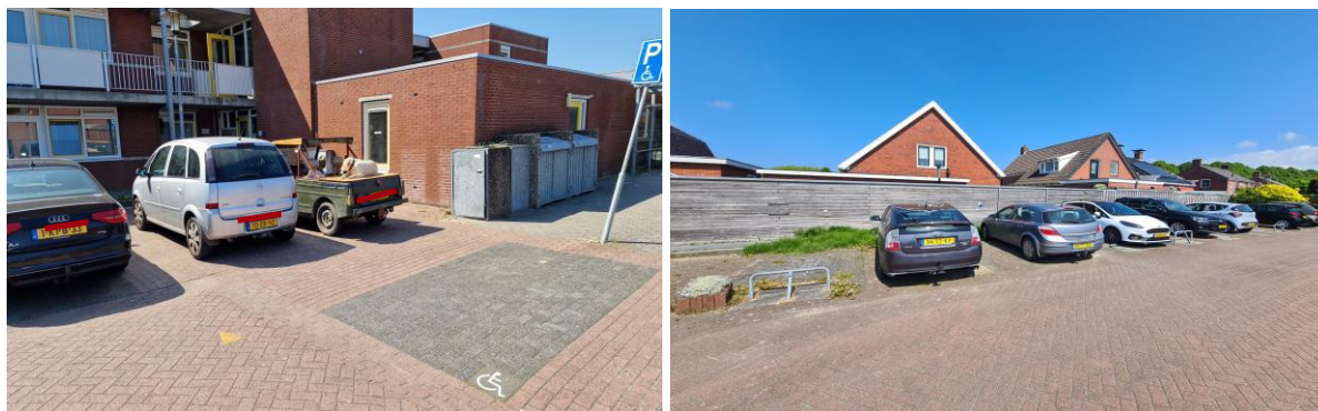
Figuur 3.2 Geparkeerde voertuigen achter invalideparkeerplaats (links) en gereserveerde parkeerplaatsen (rechts)