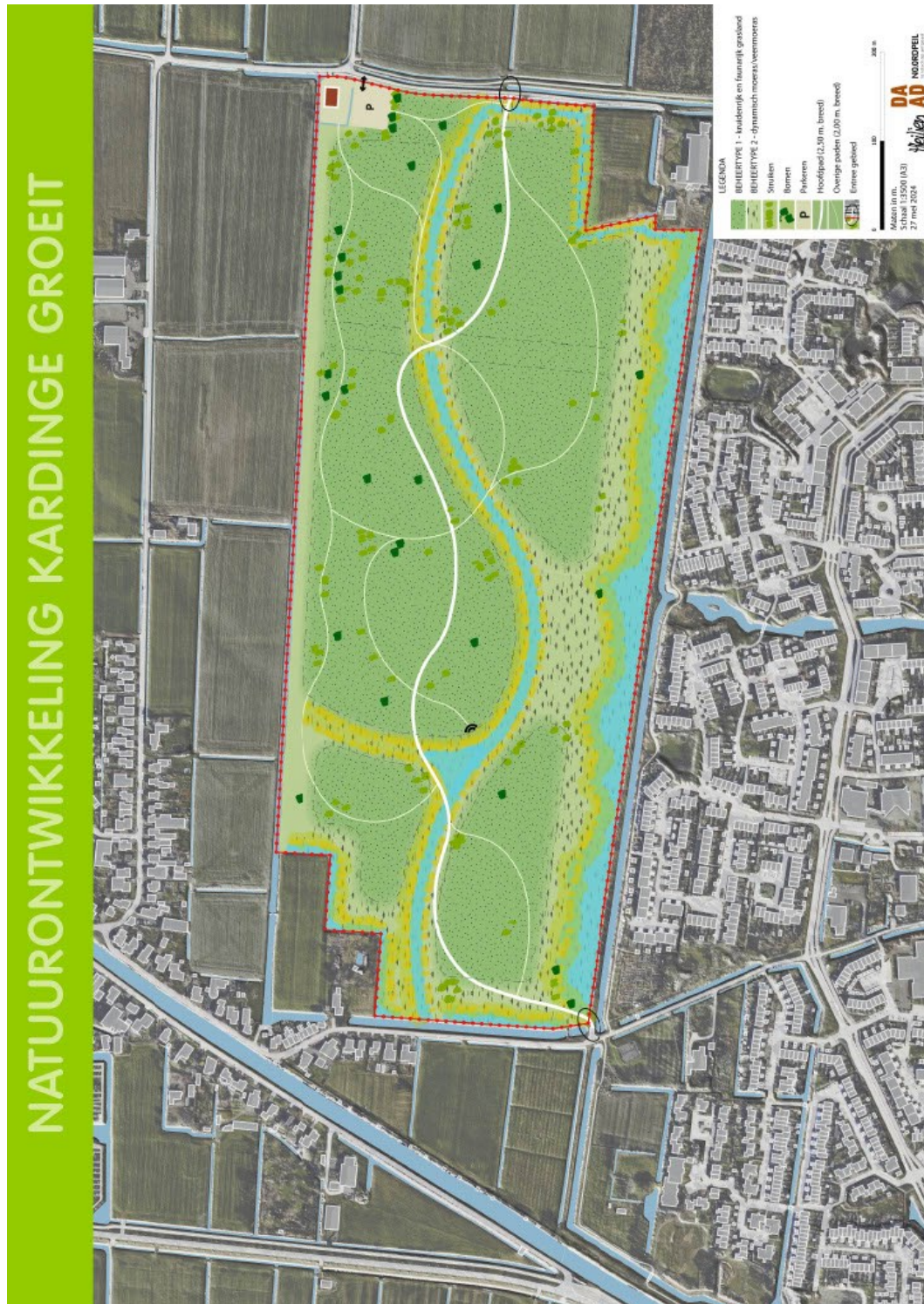
Figuur 1.2 Impressie van de toekomstige natuurbegraafplaats.