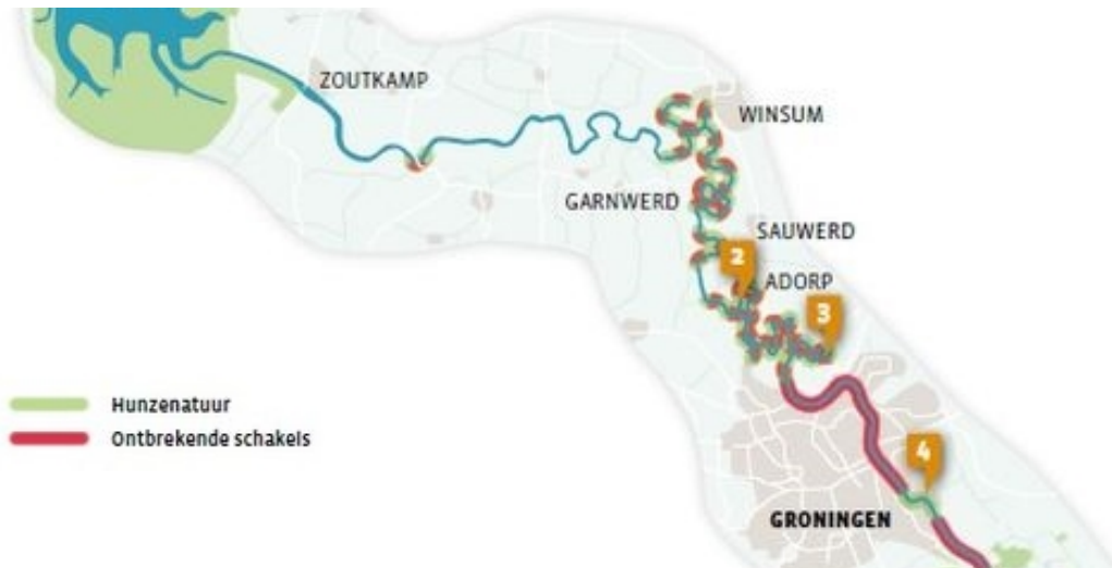
Figuur 2: de ontbrekende schakels in de Hunzevisie 2023

Het Oude Diepgebied is onderdeel van het Reitdiepdal en valt daarmee onder de Hunzevisie 2030 van Het Groninger Landschap. Ooit was de Hunze een kronkelende beek, die Drenthe met de Waddenzee verbond. Waar de Hunzevisie zich voorheen richtte op het gebied tussen Drenthe en het Zuidlaardermeergebied, kijkt de nieuwe Hunzevisie verder noordwaarts, richting de Waddenzee. Eerst door de stad Groningen en vervolgens kronkelend door de oude Hunze-meanders richting het Lauwersmeer, waar het water in de Waddenzee stroomt. De Hunzevisie 2030 streeft ernaar de oude Hunze terug te brengen door in te zetten op natte natuur, waterberging, recreatie, duurzame economische ontwikkeling en waterbeheer.