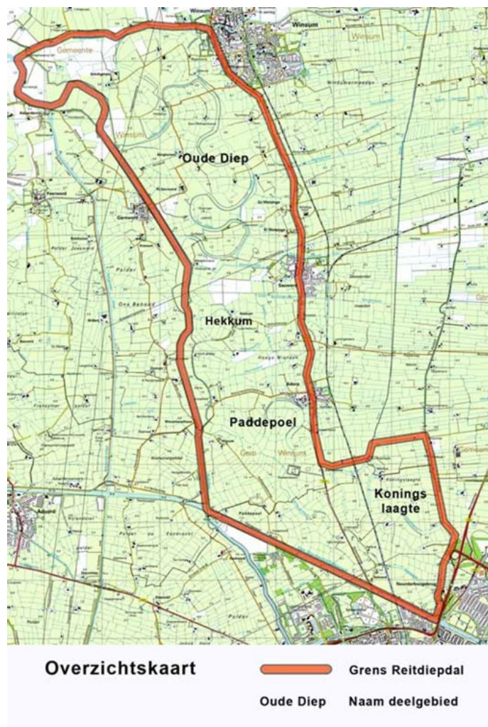
Figuur 1: overzicht gebieden in het Reitdiepdal

Een groot deel van het Reitdiepdal is kerngebied binnen het Natuurnetwerk Nederland (NNN) en is voor een deel in eigendom en beheer van het Groninger Landschap. Deze NNN-status is te danken aan het cultuurhistorische open weidelandschap (oudste cultuurlandschap van West-Europa) en de betekenis ervan voor weidevogels. Verder bestaat het NNN in het Reitdiepgebied uit beheersgebieden. In beheersgebieden kunnen agrarische ondernemers een beheersvergoeding krijgen voor bepaalde inspanningen, zoals bijvoorbeeld het later maaien of minder bemesten. Tevens wordt bij het beheer van het Reitdiepdal nauw samengewerkt met de boeren uit de omgeving die aangesloten zijn bij de organisatie BoerenNatuur Groningen West.