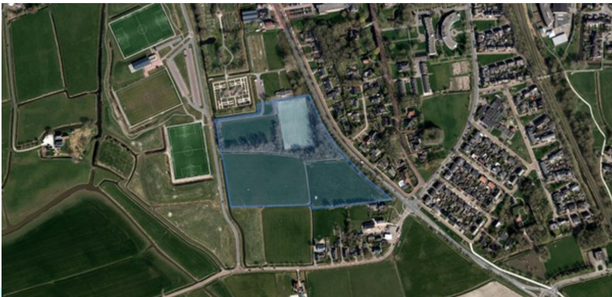
Locatie ten zuiden van de sportvelden in Winsum - Garnwerderwe g