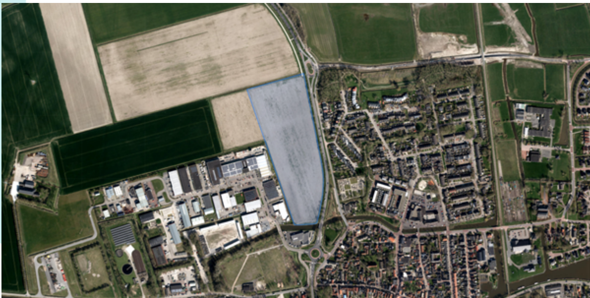
Locatie tussen bedrijventerrein Het Aanleg en de N361 in Winsum