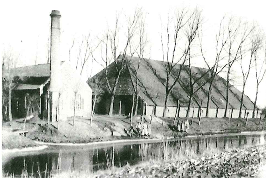
Afbeelding traject voormalig pad naar de vlasfabriek