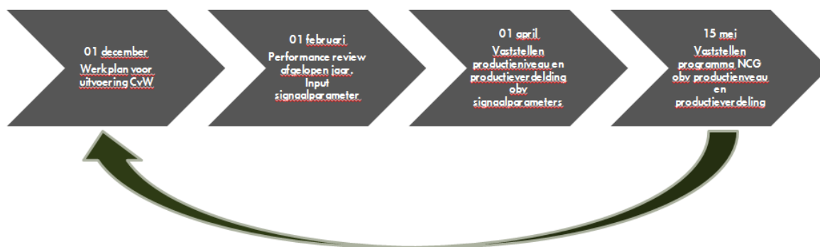
Figuur 3 gezamenlijke planning met de NCG