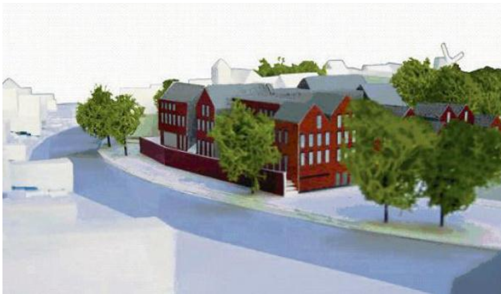
figuur 2-2 Impressie ontwerp nieuw Boogplein

groep en klankbordgroep voor De Zwarte Hond, zodat de opdracht aan dit bureau gegund wordt. 14