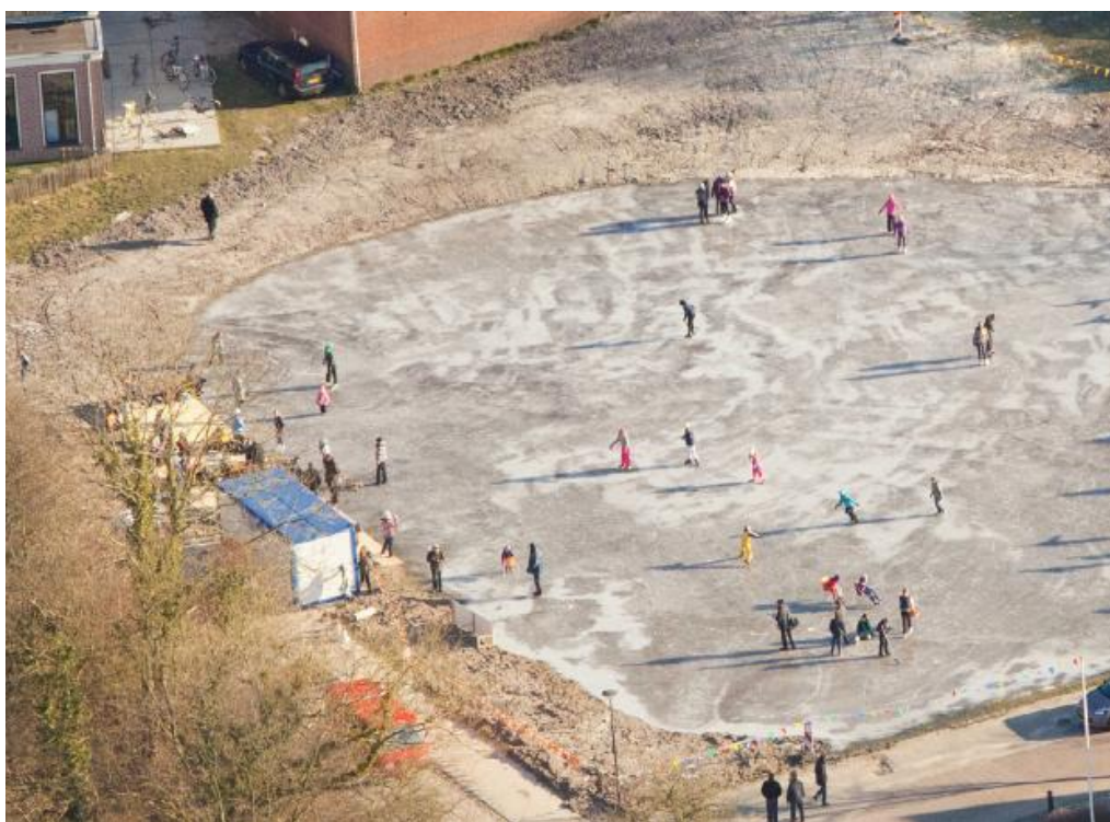
figuur 2-3 Het Boogplein in gebruik als ijsbaan

De gemeente en Montagne laten vervolgens – in augustus 2010 – beide een taxatie uitvoeren van de waarde van de uit te geven grond. De uitkomsten van de twee taxaties blijken totaal verschillend – volgens de taxatie in opdracht van de gemeente is de grondwaarde €1,5 mln. positief, volgens die in opdracht van Montagne €1,0 mln. negatief. 37 Het is echter duidelijk dat beide taxaties niet op dezelfde uitgangspunten gebaseerd zijn. Een logisch vervolg is dus in gesprek gaan over de uitgangspunten voor de taxatie.