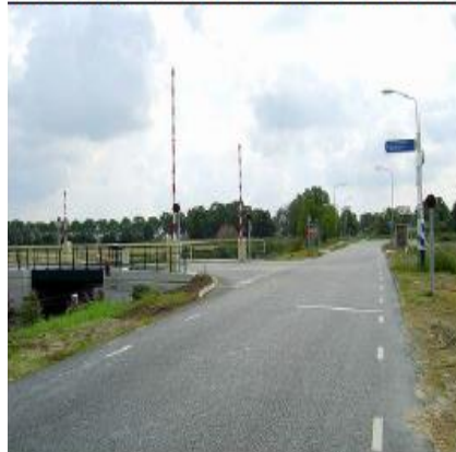
Aansluiting Boterdiep Westzijde (voorbeeld)