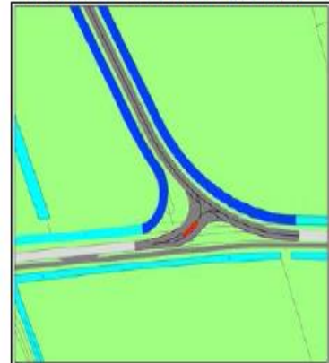
Figuur 2 voorbeelden aansluitingen Boterdiep Wz en St Annerweg