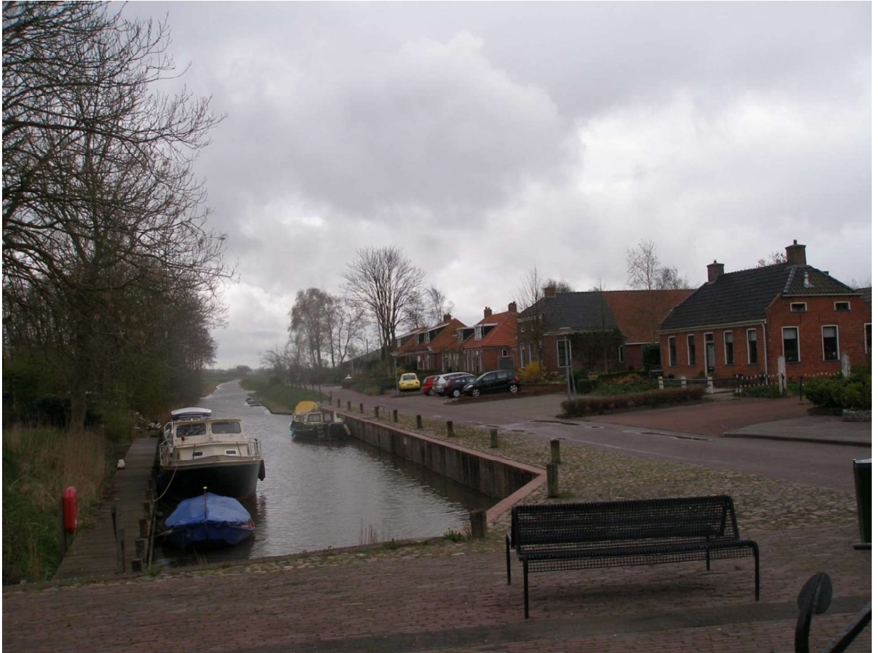
Molenrij, Haven 2016

De Haven is noord-zuid gericht, met een kade en aanlegwal aan de westkant. Op de kop van de Haven is een kleine openbare ruimte ingericht met een bankje, bloembakken en een anker. Vanaf de kop van de Haven is een zichtlijn naar het open landschap ten noorden en zuiden van het dorp. De oostkant van de Haven heeft een natuurlijke walkant, met beeldbepalende bomen tot de huidige zwaaiikom. Het dorp heeft daardoor, samen met de bomen van de tuinen en het recreatiebedrijf, ook aan de zuidkant een groen karakter.