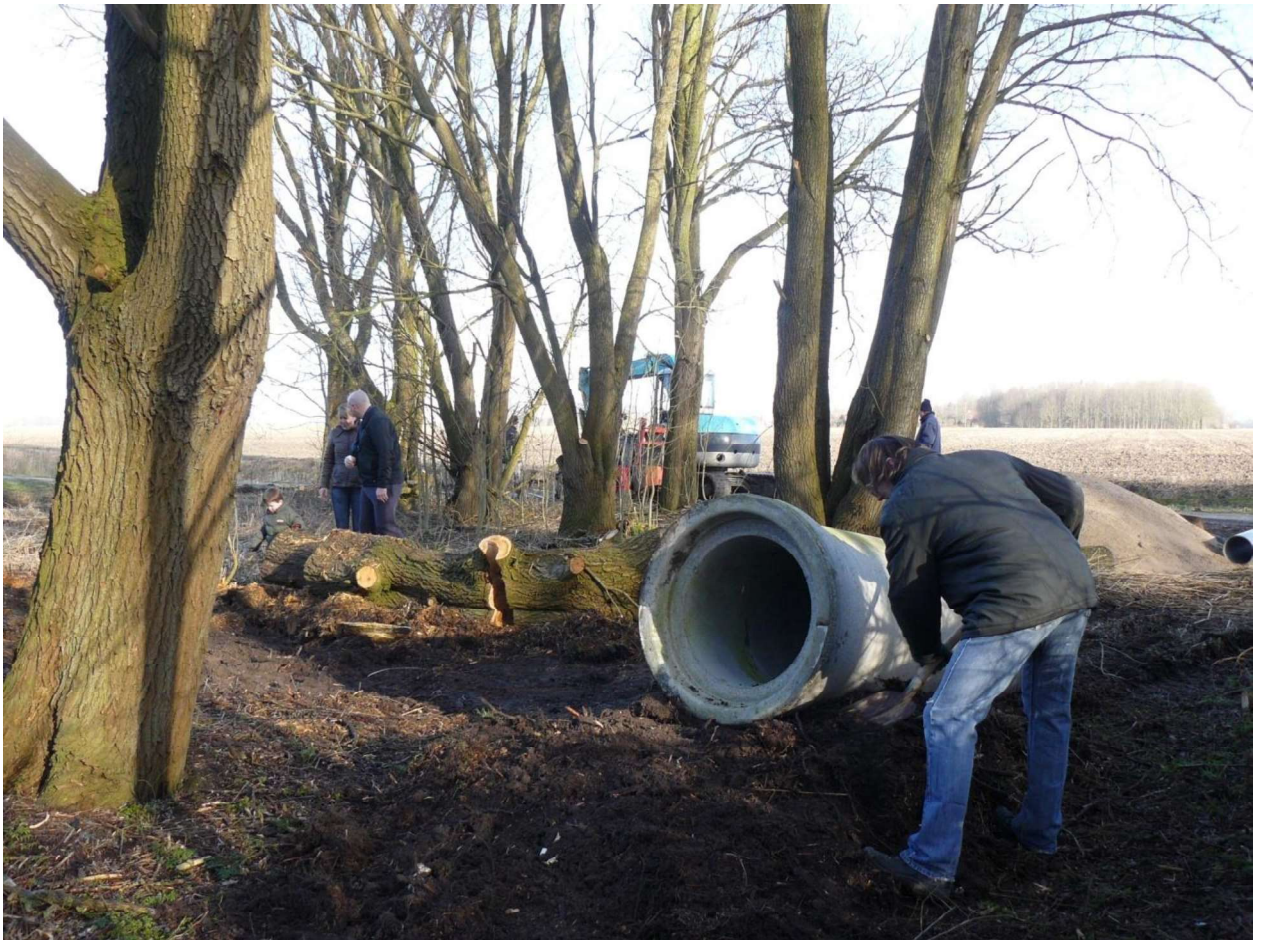
Aanleg van het Speelbos

Ondanks dat Molenrij geen dorpshuis meer heeft worden door Dorpsbelangen Rieg toch ontmoetingsactiviteiten georganiseerd waarbij gebruik gemaakt kan worden van het Speelbos, de kop van de Haven, bedrijfsruimten of particuliere ruimten van inwoners. Dit houdt in dat een dorp een wisselende ontmoetingsplek heeft voor haar inwoners waar ze met enige regelmaat elkaar kunnen ontmoeten en activiteiten kunnen ondernemen. In principe is een locatie aanwezig voor ledenvergaderingen en de winterse bijeenkomsten gevonden in de caféruimte van 't Korensant.