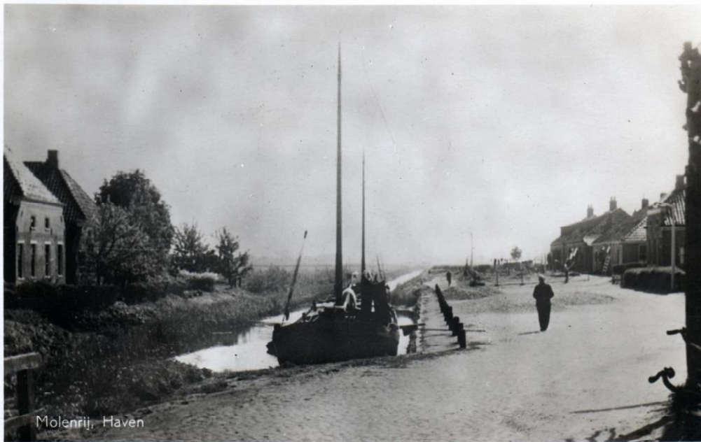
Haven, ca. 1930

De tweede uitbreiding van het dorp vond plaats in de jaren 1920-1930 aan de westelijke uitvalsweg richting Kloosterburen. Het betreft een reeks karakteristieke woningen met kenmerken van de Amsterdamse School en soms gemetseld in ruwe sintersteen. Daarmee was de ontwikkeling van Molenrij in hoofdlijnen afgerond. Het dorp had indertijd ca. 450 inwoners. Een aansluiting van de bebouwing met Kloosterburen kwam niet tot stand, en Molenrij heeft daardoor een eigen karakteristieke stedenbouwkundige eenheid behouden. 6