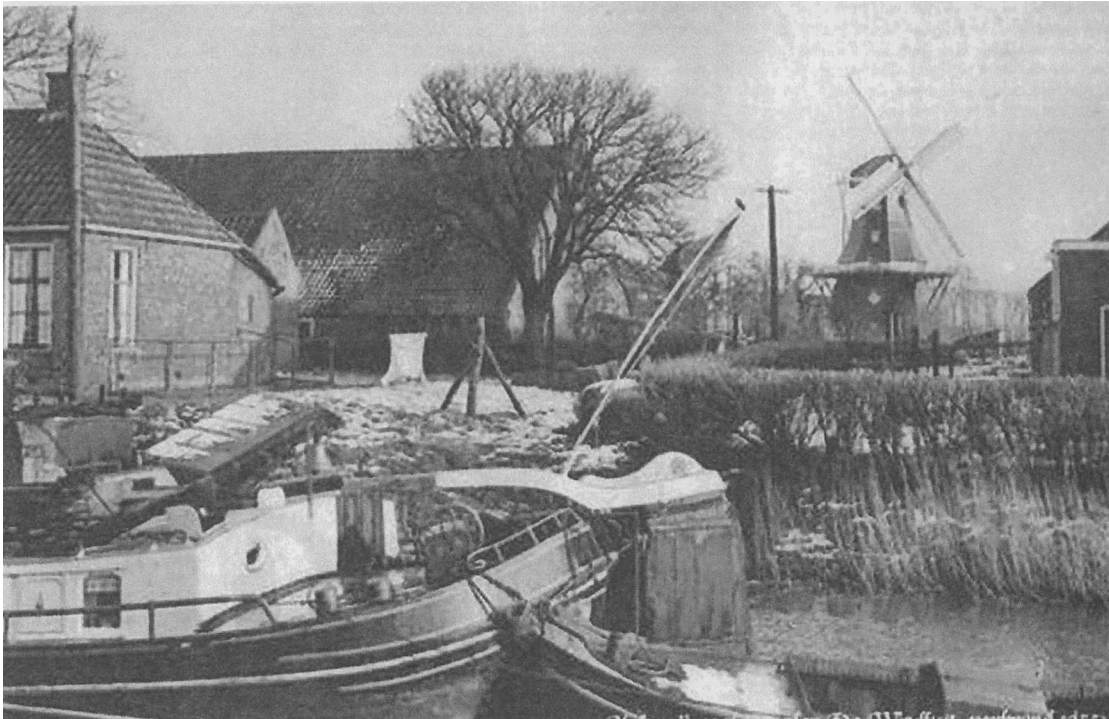
Haven oostzijde en molen de Windlust, ca. 1930

korenmolen, die in 1889 werd afgebroken, en door een achtkante stellingmolen met bovenkruier werd vervangen. Deze molen, de Windlust, brandde in 1955 af. 3 Aan de westzijde van de Haven stond omstreeks 1866 eveneens een koren- en pelmolen, die in 1900 werd verkocht en afgebroken. De onderdelen werden mogelijk naar Nijkerk getransporteerd. 4