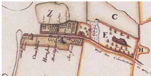
Molenrij 1727, kaart van Folkert Teijsinga.

Molenrij ligt aan een aftakking hiervan en ontstond als een verbindingspunt van water- en landwegen en als een laad- en losplaats voor agrarische producten vanuit de regio en zaken, waar men in de omgeving behoefte aan had, zoals baksteen en turf. Gezien de datering van een molen rond 1540, was er toen waarschijnlijk ook een bebouwing.