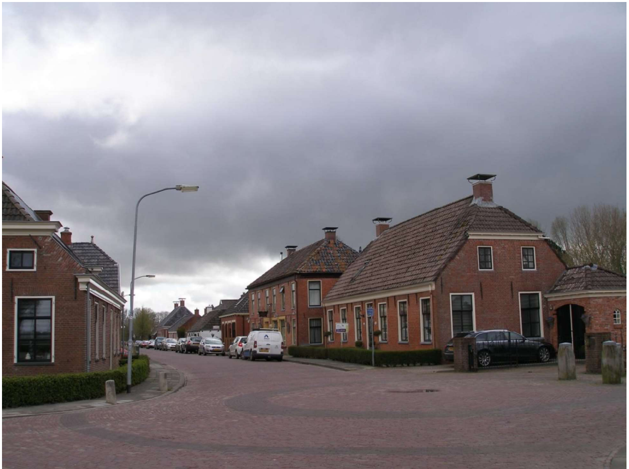
Molenrij, Van Cappenbergweg richting Wehe-den-Hoorn

Op 6 september 2013 heeft de dorpsvereniging, Dorpsbelangen Rieg, naar aanleiding van deze Structuurvisie een zienswijze ingediend. Dit als een eerste reactie naar de gemeente toe, maar ook om eventueel bij toekomstige ontwikkelingen en aanpassingen van bestemmingsplannen zeggenschap te kunnen hebben en als vertegenwoordiger van het dorp ontvankelijk te kunnen zijn bij procedures. 1