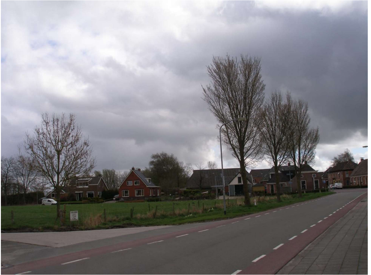
Molenrij, bebouwing Witherenweg