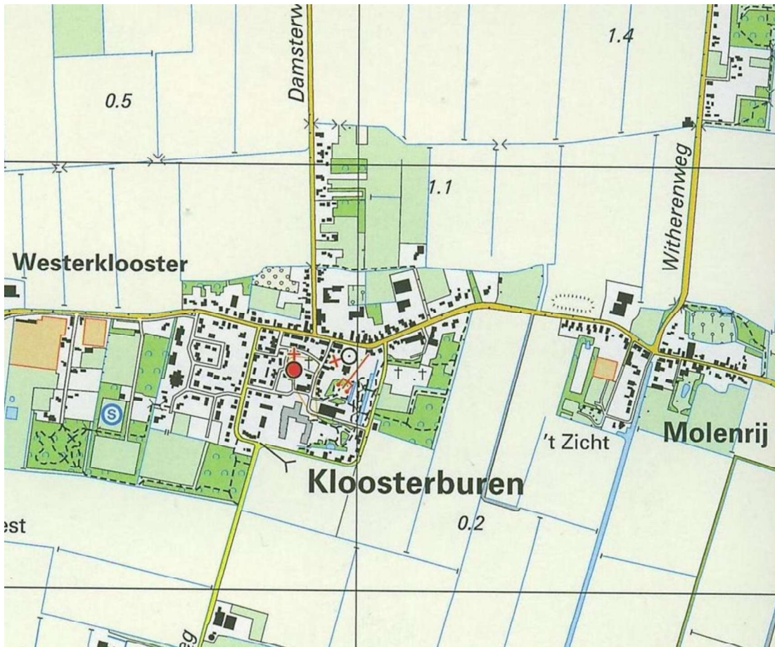
Kloosterburen en Molenrij. Topografische Kaart 2006.

De uitbreidingen van de bebouwing zijn kleinschalig van aard gebleven en niet hoger dan een bouwlaag met een kap. Het oudste gebouw in Molenrij, 't Korensant heeft een begane grond, verdieping en kap en vormt daarmee een historische uitzondering. Rondom, en tot aan de uiteinden van de vroegere dorpsstraat heeft de bebouwing een bescheiden maat en schaal behouden. Deze bebouwing wordt gekenmerkt door één bouwlaag met zadeldaken of schilddaken met donker gesmoorde of rode dakpannen. De oudere huizen hebben gevels met een verticale geleding door schuiframen. Woningen uit de 30er en 80er jaren van de 20 ste eeuw zijn daarop een uitzondering.