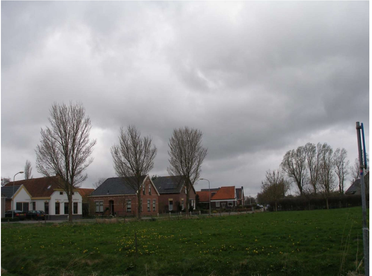
Van Cappenbergweg westzijde

De meest recente uitbreiding kwam tot stand aan de noordelijke uitvalsweg, de Witherenweg, met een woning uit de 80er jaren van de vorige eeuw. Daar is ook het verkavelingsbos, met tot op heden de functie van een natuurlijke speelplek, het Speelbos.