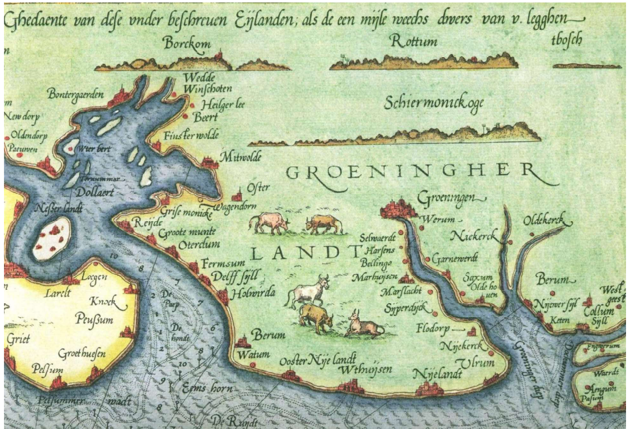
Kaart met omgekeerde oriëntering van de waddendijk met o.a. Uithuizen, (Wester)Nieuwland en Ulrum. Lucas Janz. Waghenaer, Spieghel der Zeevaerdt, 1584.

De dijken van de eilandpolder De Marne volgen de kwelderwallen en de daarop aansluitende landinwaarts gerichte kwelderwallen, de zgn. haakwallen. Dit levert een dijk- en wegenpatroon op, waarvan de inpolderinggeschiedenis duidelijk afleesbaar is. Onlosmakelijk deel van deze inpolderinggeschiedenis is de stichting in 1163 van het Oldeclooster in Kloosterburen, in samenhang met de inpoldering en bedijking van het eiland De Marne. Direct ten noorden van de uitvalsweg van Molenrij naar Kloosterburen is als een verhoging in het landschap nog een restant van de oude dijk en misschien ook een wierde zichtbaar.