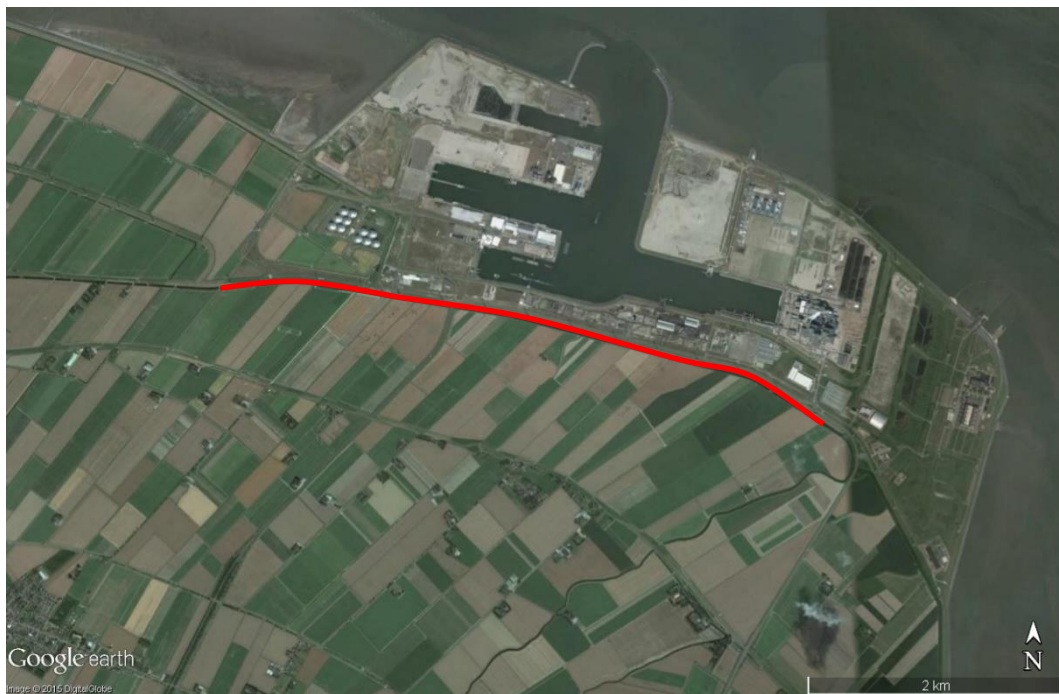
Figuur 1 Globale situering van het plangebied. Het onderzochte dijktraject wordt weergegeven met de rode lijn.

Men is voornemens een zonnenveld aan te leggen op het zuidtalud van de dijk. Het veld loopt vanaf de voet van de dijk tot aan de kruin en strekt zich uit over de gehele lengte van het dijktraject. Aan de noordkant van de dijk worden in de lengterichting over het gehele traject twee afrasteringen geplaatst.