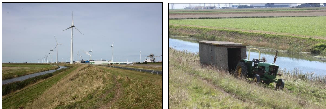
Figuur 3 Overzicht van het plangebied. Op de linker foto de dijk met Binnenbermsloot en hekwerk. Op de rechter foto de enige bebouwing op de dijk.

De begroeiing op de dijk is over het gehele traject vrij uniform en wordt kortgehouden door schapen. Er zijn geen bomen aanwezig. De vegetatie bestaat voornamelijk uit grassen en distels. Het tracé ten westen van de N46 is wat groener en gras is voller. Waarschijnlijk wordt dit deel iets minder intensief begraasd. Ook hier echter is sprake van een uniforme vegetatie voornamelijk gevormd door grassoorten en distels. De Binnenbermsloot is beschoeid. Langs de oever is een vrij brede strook van riet en/of flab aanwezig. Op de dijk staan windmolens (circa om de 300 meter) en een klein schuurtje. Hierin lag een schaap wat al enige tijd dood was.