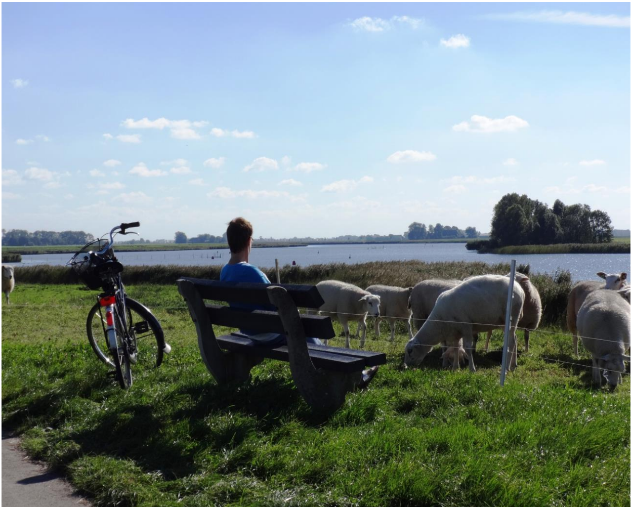
Uitzicht over het Reitdiep