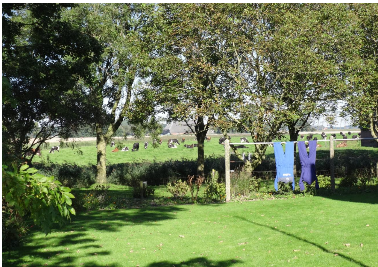
Overalls bij Houwerzijl