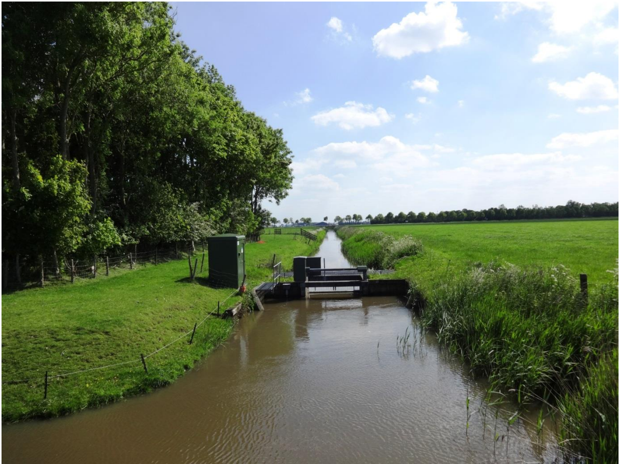
Vd Brielweg Ulrum