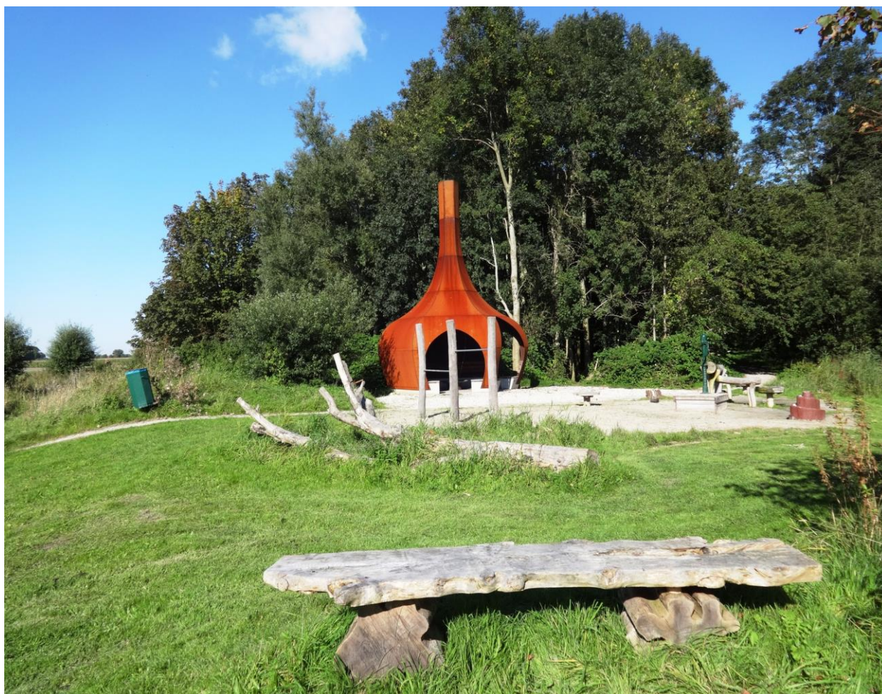
Speelbos bij Houwerzijl